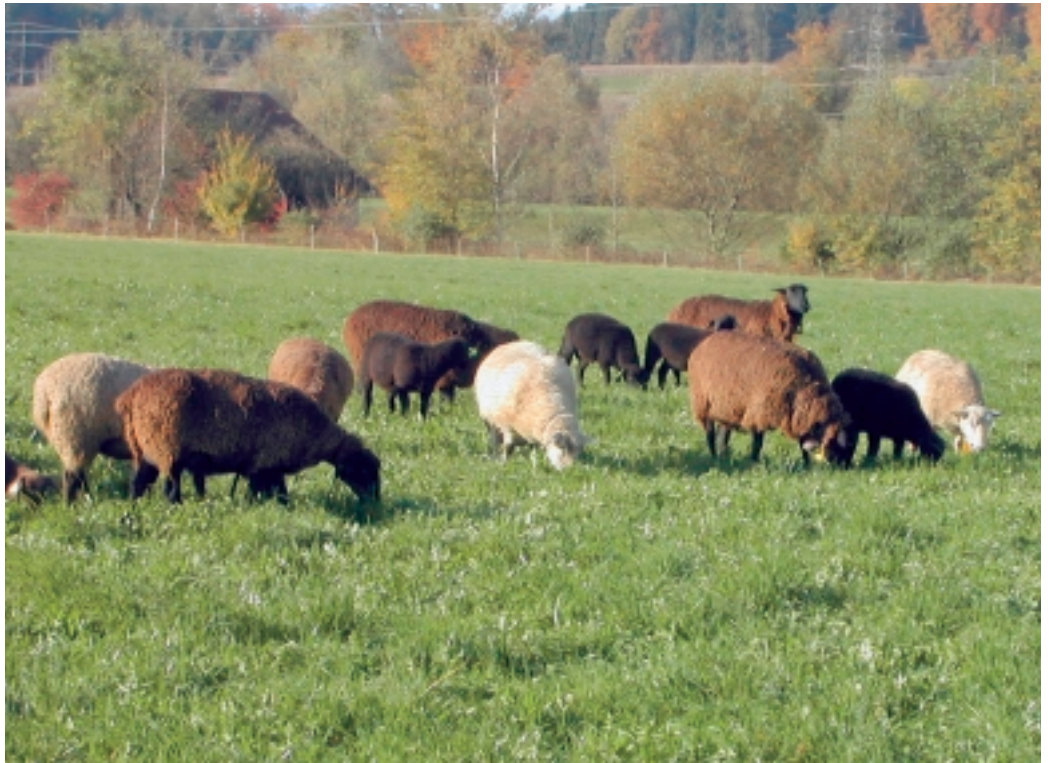
Abbildung 1 Kreuzungsauen mit verschiedenem Anteil der Rassen Schwarzbraunes Bergschaf, Charollais und Weisses Alpenschaf auf der Weide der Versuchsstation Chamau.

Auf der ETH-Versuchsstation Chamau wurde in einem Versuch die Eignung der Dorper-Rasse für Gebrauchs-kreuzungen zur Erzeugung von Qualitätsschlachtlämmern abgeklärt. Die im folgenden Beitrag präsentierten Resultate zeigen, dass beim Einsatz von Dorperwiddern im Vergleich zu WAS-Widdern eine bessere Schlachtausbeute sowie eine bessere Taxation der Schlachtkörper erreicht wird, was sich in einem um rund 10 % höheren Erlös je Schlachtlamm niederschlägt.