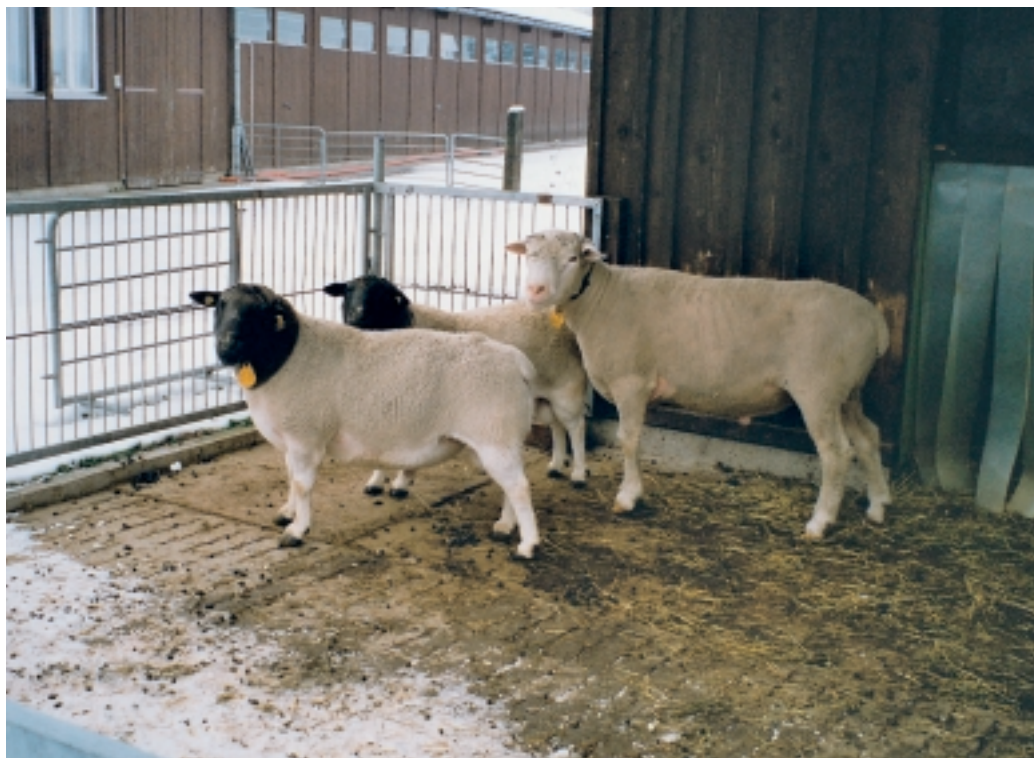
Abbildung 2 Im Versuch eingesetzte Dorper- und WAS-Widder.

La station de recherches de Chamau a procédé à un essai concernant l'aptitude de la race Dorper à produire des agneaux de boucherie de qualité, via les croisements industriels. Les résultats présentés ci-après démontrent que les descendants de béliers Dorper permettent d'obtenir un meilleur rendement à l'abattage et une meilleure taxation des carcasses, par rapport aux descendants de béliers BA. D'où un gain plus élevé (env.10%) par agneau.