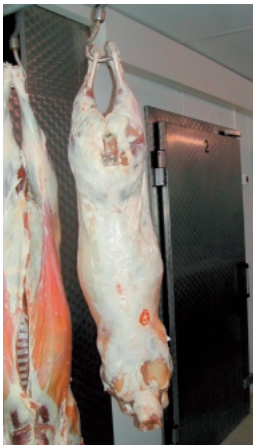
Photo 5: Carcasse d'agneau engendré par un bélier BA, de 17.5 kg, taxée H3.