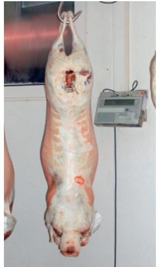
Photo 4: Carcasse d'agneau engendré par un bélier Dorper, de 19.5 kg, taxée C4.